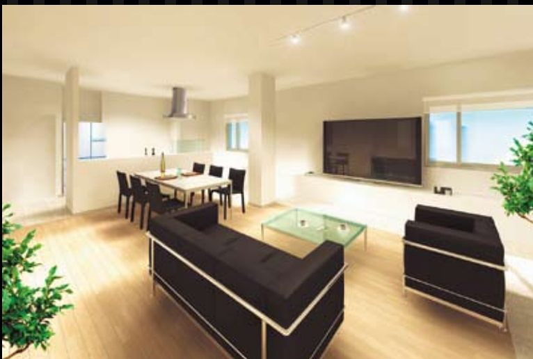
建物完成イメージ図 ※このイラストは図面を基に描きおこしたもので、実際とは異なる場合があります。