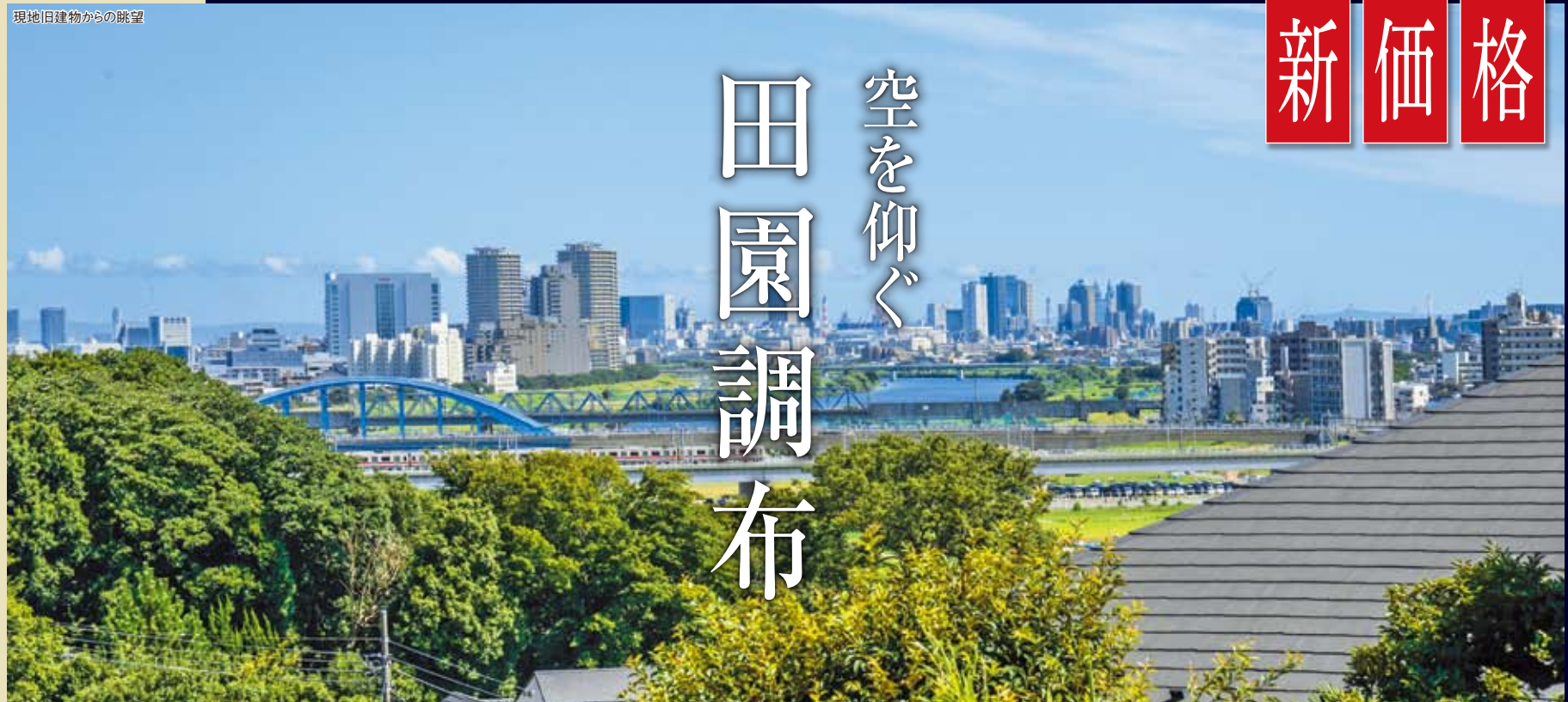
現地旧建物からの眺望