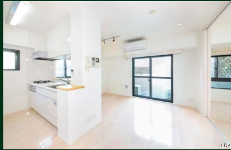
リノベーションが施されたデザイナーズマンション

専有面積 52.04 ㎡ バルコニー面積 / 6.55㎡ 販売価格 3,780 万円