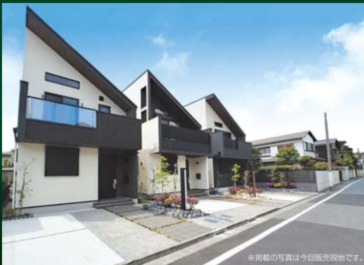
※掲載の写真は今回販売現地です。